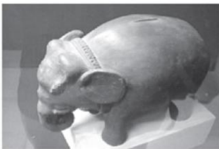
Gambar 5. Celengan Gajah Jaman Majapahit

Perwujudan deformatif gajah dalam terakota Majapahit ditandai dengan bentuk yang tidak proporsional dan tidak realis. Perwujudan ini sering ditemukan pada vas bunga berbentuk Gaja Mina, celengan berbentuk gajah, dan relief berbentuk gajah.