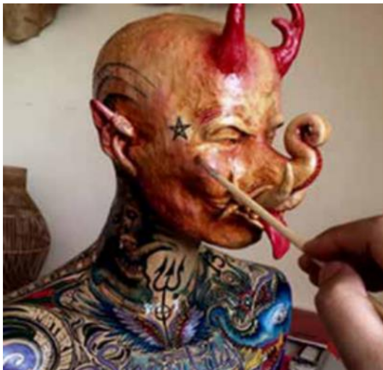
Gambar 1. Patung Kontemporer Berpedoman Konsep Hibrida Paksi Naga Liman.

Peneliti telah melakukan pencarian data terkait kereta kencana Paksi Naga Liman melalui laman connectedpapers.com . Berdasarkan ketiga penelitian tersebut dan data yang ditemukan pada connectedpapers.com , studi pemanfaatan data-data tersebut untuk prompting AI belum pernah dilakukan. Ini menjadi peluang untuk melihat bagaimana kemungkinan kecerdasan buatan menyikapi prompting yang disusun berdasarkan data etik dan emik akan Kereta Kencana Paksi Naga Liman. Namun demikian, pembahasan mengenai aspek filosofis daripada elemen-elemen yang membentuk kereta kencana Paksi Naga Liman dari Keraton Sumedang Larang ini akan dikaji secara mendalam untuk menghasilkan sebuah kajian yang komprehensif.