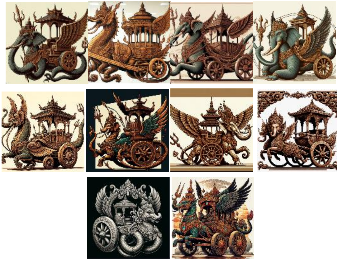
Gambar 8. Sekumpulan Hasil Generative Image Yang Paling Mendekati Prompt yang Diminta. (sumber: diolah oleh mahendra wibawa, 2023)

Percobaan lainnya menghasilkan urutan yang cukup sesuai dengan hirarki visual yang diperintahkan, namun beberapa detail masih susah untuk dapat muncul seperti yang diharapkan. Berikut adalah beberapa hasil gambar buatan AI yang dianggap mendekati perintah yang dimaksud.