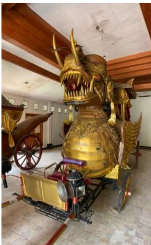
Gambar 2. Kereta Kencana Paksi Naga Liman Replika (sumber: diolah oleh Mahendra Wibawa, 2023)

Pada penelitian ini menghasilkan elemen visual, pemaknaan simbolis dan cipta ulang makna melalui sanggit. Kereta Kencana Paksi Naga Liman adalah artefak bersejarah dari Keraton Sumedang Larang, memadukan estetika dan simbolisme yang kaya. Dengan ukuran 7 meter panjang, 2,5 meter lebar, dan 3,1 meter tinggi, serta berat sekitar 2 ton [10], [11], kereta ini merupakan mahakarya artistik yang menggabungkan kekuatan garuda, kebijaksanaan naga, dan keagungan gajah. Desainnya yang unik mencerminkan integrasi ketiga simbol hewan ini. Bagian atap kereta menampilkan perpaduan garuda, naga, dan gajah, di mana wajah gajah yang menonjol di bagian depan kereta menambahkan nuansa simbolis dengan trisula dan tombak yang dipegangnya.