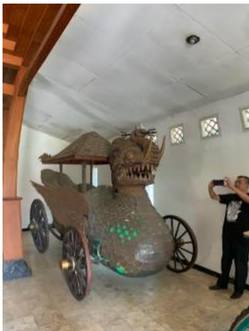
Gambar 3. Kereta Kencana Paksi Naga Liman Asli (sumber: diolah oleh Mahendra Wibawa, 2023)

Symbolisme naga dalam kebudayaan Sumedang kaya akan makna [12]. Pemaknaan ini tidak lepas dari bagaimana kebudayaan Nusantara menghadirkan sosok naga ini sejak dari era animisme, masa islam hingga saat ini. Perwujudan naga yang secara etimologi merupakan wujud dari ular kobra raksasa. Secara bentuk, ular naga khususnya di kebudayaan Jawa memiliki kemiripan dengan naga dari India dan Tiongkok. Kereta ini berwujud ular, yang panjang tanpa sayap dan kaki. Perbedaan yang mendasar pada sosok naga di Indonesia selalu digambarkan memakai mahkota. Perwujudannya banyak kita temukan melekat pada artefak-artefak kebudayaan lainnya seperti salah satunya yang berupa dekorasi tiang gantungan gamelan.