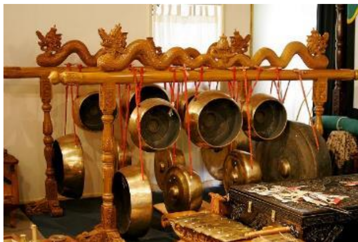
Gambar 4. Hiasan Ular Naga Pada Alat Musik Gong.

Symbolisme naga dalam kebudayaan Sumedang kaya akan makna [12]. Pemaknaan ini tidak lepas dari bagaimana kebudayaan Nusantara menghadirkan sosok naga ini sejak dari era animisme, masa islam hingga saat ini. Perwujudan naga yang secara etimologi merupakan wujud dari ular kobra raksasa. Secara bentuk, ular naga khususnya di kebudayaan Jawa memiliki kemiripan dengan naga dari India dan Tiongkok. Kereta ini berwujud ular, yang panjang tanpa sayap dan kaki. Perbedaan yang mendasar pada sosok naga di Indonesia selalu digambarkan memakai mahkota. Perwujudannya banyak kita temukan melekat pada artefak-artefak kebudayaan lainnya seperti salah satunya yang berupa dekorasi tiang gantungan gamelan.