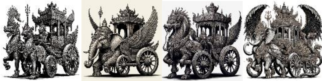
Gambar 7. Sekumpulan hasil generative image yang dianggap gagal.

Percobaan lainnya menghasilkan urutan yang cukup sesuai dengan hirarki visual yang diperintahkan, namun beberapa detail masih susah untuk dapat muncul seperti yang diharapkan. Berikut adalah beberapa hasil gambar buatan AI yang dianggap mendekati perintah yang dimaksud.