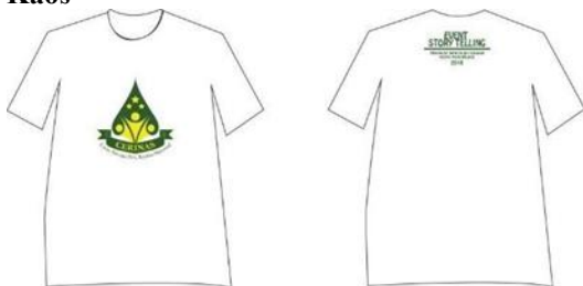
Gambar 12. Kaos Event Story Telling CERINAS

Kaos merupakan salah satu merchandise yang digunakan untuk menunjang promosi event story telling CERINAS.