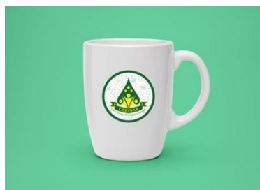
Gambar 13. Mug Event Story Telling CERINAS

Mug merupakan salah satu merchandise yang digunakan untuk menunjang promosi event story telling CERINAS.