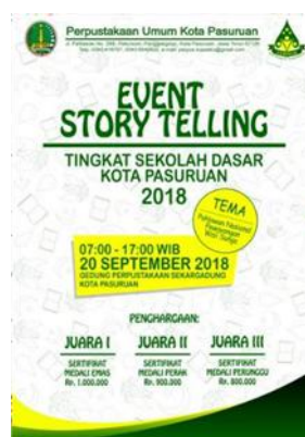
Gambar 3. Poster Event Story Telling CERINAS