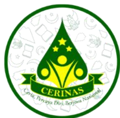
Gambar 11. Pin dan Gantungan Kunci Event Story Telling CERINAS