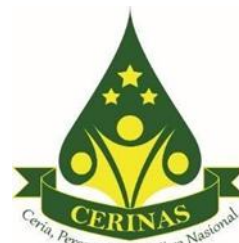
Gambar 2. Logo CERINAS

Konsep dalam pembuatan logo CERINAS mengkombinasikan antara gunung wayang dan tiga anak-anak dengan penambahan tiga bintang di atasnya mencerminkan sebuah kompetisi yang bertujuan untuk meraih impian melalui tema cerita kebudayaan lokal. Pemberian warna hijau tua pada gunung wayang mencerminkan keharmonisan dan kealamian suatu budaya, sedangkan pemberian warna kuning pada tiga gambar anak – anak dan tiga bintang mencerminkan keceriaan dan semangat dalam menggapai impian.