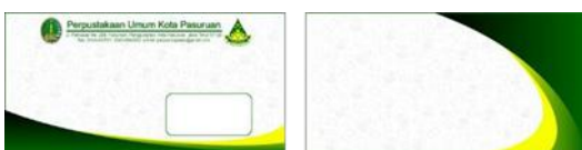
Gambar 6. Amplop Undangan Event Story Telling CERINAS