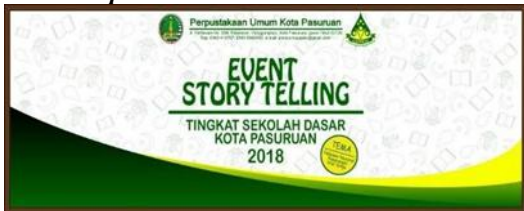
Gambar 5. Back Drop Event Story Telling CERINAS