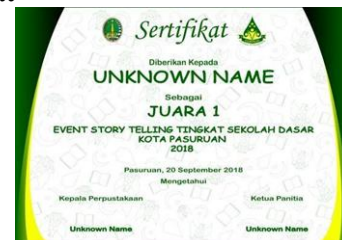
Gambar 8. Sertifikat Event Story Telling CERINAS