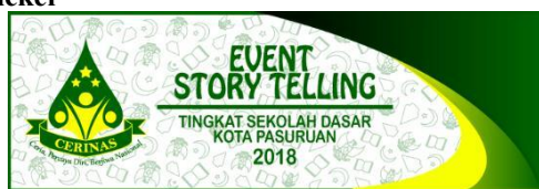
Gambar 10. Sticker Event Story Telling CERINAS