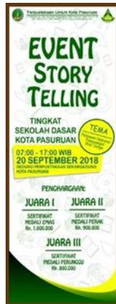
Gambar 4. X Banner Event Story Telling CERINAS

X Banner CERINAS sebagai media promosi menampilkan informasi penyelenggaraan event story telling tingkat sekolah dasar kota Pasuruan.