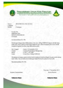
Gambar 9. Head Letter Event Story Telling CERINAS

Head Letter digunakan untuk menyampaikan informasi kepada seseorang yang akan dituju.