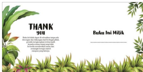
Gambar 3 Halaman Awal Buku

Bagian di dalam halaman awal ini terdapat buku ini milik pembeli buku tersebut, agar buku ini tidak mudah hilang atau tertukar.