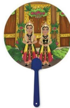
Gambar 11 Kipas