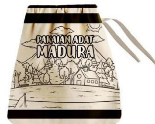
Gambar 12 Packaging