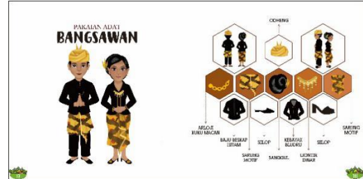
Gambar 5 Halaman Materi Buku