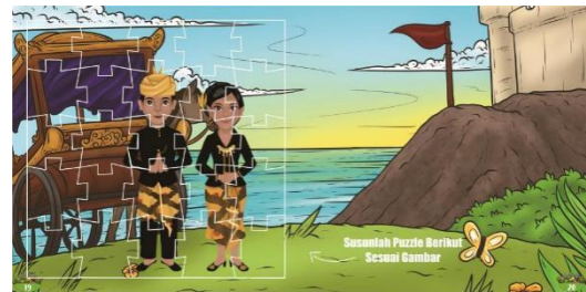
Gambar 6 Halaman Penutup

Dihalaman penutup terdapat evaluasi hasil anak-anak setelah membaca buku tersebut dengan mengurutkan gambar melalui puzzle .