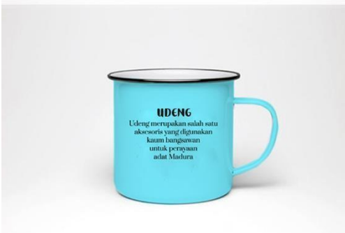
Gambar 8 Gelas