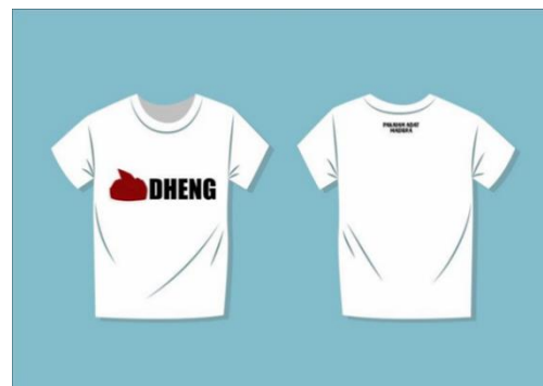
Gambar 13 T-Shirt