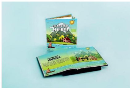
Gambar 2 Buku Pakaian Adat Madura

Jumlah Halaman : 26 halaman, 11 Lembar, mengaitkan dengan sumber rujukan yang relevan.