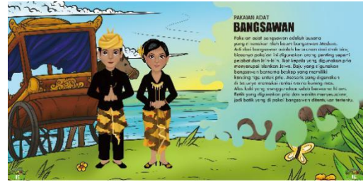
Gambar 4 Halaman Isi Buku

Dihalaman isi terdapat nama dari jenis pakaian adat beserta penjelasannya. Halaman isi kedua menjelaskan nama-nama aksesoris dari pakaian adat Madura.