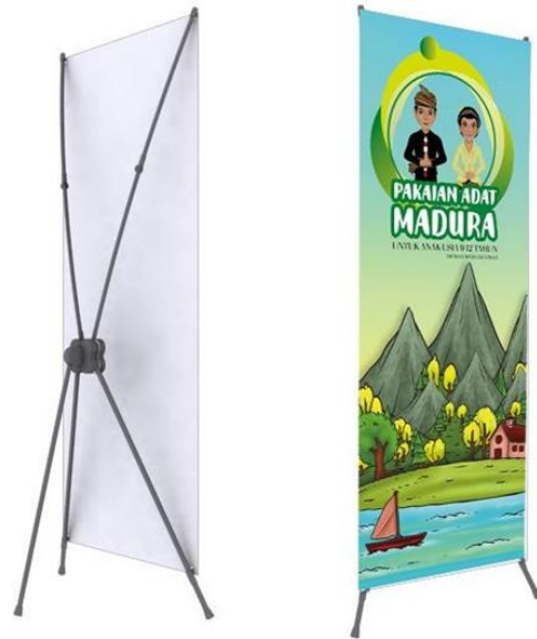
Gambar 10 X Banner