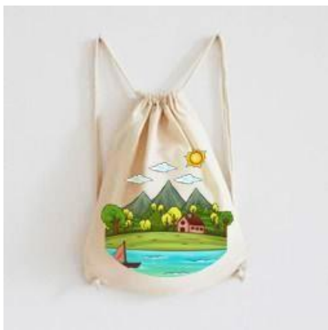
Gambar 9 Tote Bag