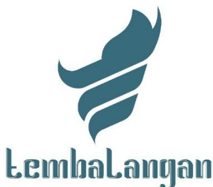
Gambar 7. Media Pendukung yang berupa Logotype yang disematkan pada Logogram Tembalangan

Implementasi pada media pendukung yang pertama adalah pada logotype dari Desa Tembalangan. Kesatuan logo yang terdiri dari logogram dan logotype ini dirancang agar saling bersinergi dan memiliki makna yang sama didalamnya agar saling berkaitan dalam menunjang identitas kampung Tembalangan.