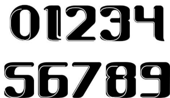
Gambar 3. Susunan Angka pada Karya Typeface

Kategori selanjutnya adalah susunan angka lengkap berjumlah 10 karakter yang terdiri dari angka 0 hingga angka 9. Bentuk dari anatomi angka dirancang sebagaimana mungkin agar memiliki karakter yang sama dengan kategori huruf agar nampak adanya kesinambungan sehingga perancang juga membatasi kreasi bentuk anatomi angka agar tidak terlalu berlebihan dan sesuai dengan kaidah yang ada.