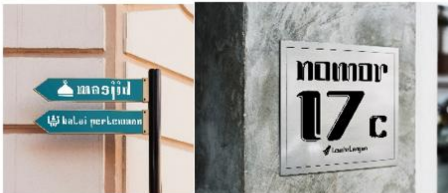
Gambar 9. Media Pendukung pada Sign System

Implementasi pada media pendukung yang terakhir adalah pada sign system . Sign system yang ditargetkan adalah yang berada di area kampung Tembalangan sendiri. Beberapa sign system tersebut dihadirkan untuk memberi penjelasan suatu tempat yang disesuaikan dengan kebutuhan. Tempat tersebut mencakup mulai dari tempat umum, fasilitas umum, keterangan pada rumah warga, nama gang, nama jalan, nama wilayah, dan lain-lain.