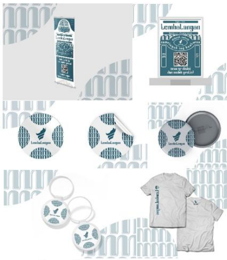
Gambar 8. Media Pendukung pada Stationery dan Merchandise