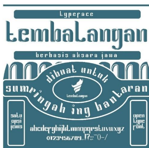
Gambar 6. Preview Media Utama