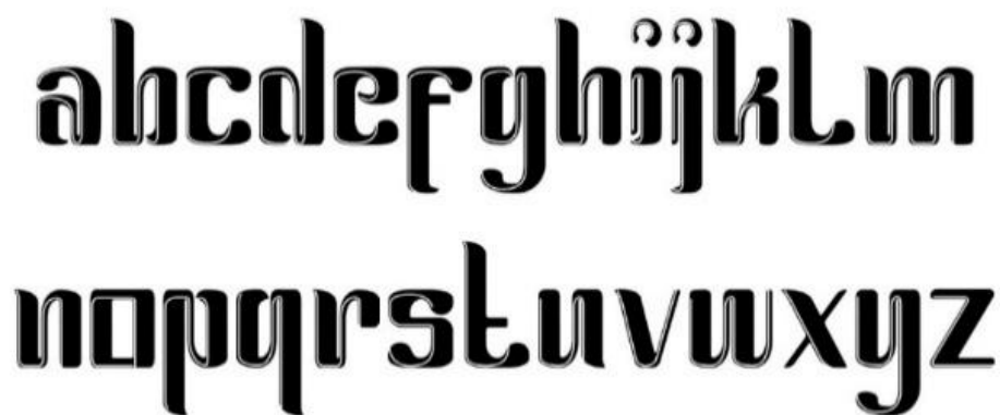
Gambar 2. Susunan Huruf pada Karya Typeface

Kategori utama dari karya typeface ini adalah berupa susunan huruf lengkap a-z. Susunan huruf ini dikatakan sebagai karakter utama sebab karakter-karakter tersebut yang paling dibutuhkan dan akan paling banyak diaplikasikan dalam rangka menunjang kebutuhan identitas kampung Tembalangan.