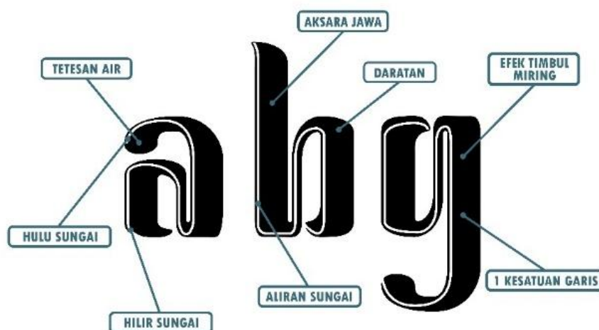
Gambar 5. Elemen-elemen pada Karya Typeface (sumber: dokumentasi penulis)

Elemen yang dihadirkan yaitu tetesan air, aliran sungai, kontur tanah (pada efek timbul miring), dan yang utamanya adalah corak karakter yang diadopsi dari aksara Jawa yang juga disesuaikan dengan teori anatomi aksara Jawa yang sudah ada. Seluruh elemen tersebut diambil berdasarkan beberapa alasan dan dipertimbangkan dari kebutuhan identitas kampung Tembalangan, tanpa mengganggu kaidah typeface yang ada.